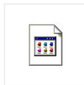
Adobe Photoshop CS4.zip.001